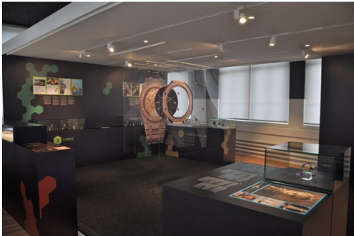
Exposition « Montre icône », Royal Oak, Audemars Piguet, à l'Espace Horloger de la Vallée de Joux.

poignet. Du jour au lendemain, la montre va connaître un succès sans précédent et bouleverser le paysage horloger mondial.