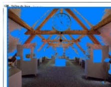
L'horlogerie au musée

Genre de média: Médias imprimés Type de média: Magazines spéc. et de loisir Tirage: 2'200 Parution: 4x/année