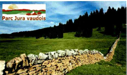
Parc Jura vaudois

Naturpark Jura vaudois: Trockenmauern queren immer wieder die Weiden.