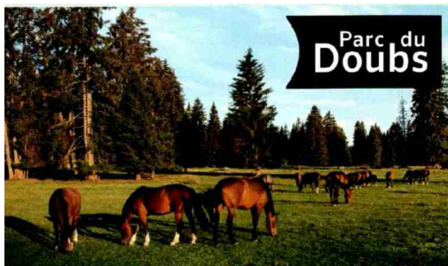
Parc du Doubs

Die Naturpärke des Jurabogens bieten spannende Natur- und authentische Kulturerlebnisse. Sie sind gekennzeichnet durch sanfte Juraweiden, die typische Jura-Geologie sowie die gemeinsame kulinarische und Industrietradition.