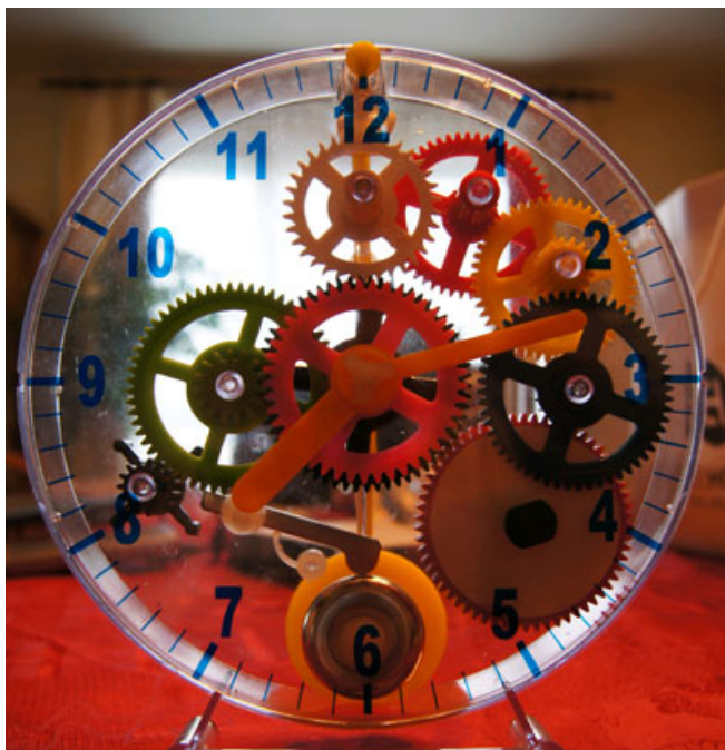
My First Clock assemblée et fonctionnelle.

N° de thème: 781.42 N° d'abonnement: 1089806