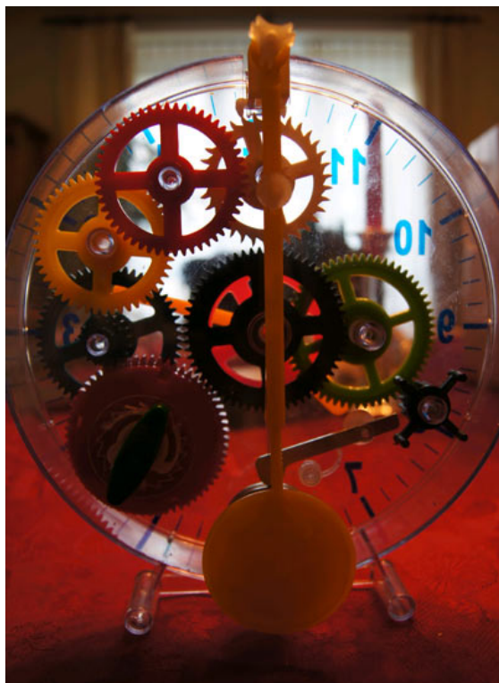
L'horloge vue côté balancier avec la clé pour remonter le barillet.

Facilement trouvable en ligne en cherchant « My First Clock » ou « D.I.Y. Clock » ou, encore mieux, à la boutique de l'EHVJ au Sentier pour ceux qui ont la chance d'y aller, ce jouet éducatif serait inspiré, si l'on en croit la notice, d'une horloge italienne de 1350.