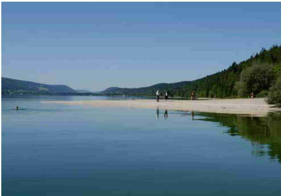
Photographie en haut de page: la Dent de Vaulion offre une vue panoramique à couper le souffle sur l'ensemble de la vallée de Joux. Photo en bas de page: les multiples baies cernées par la forêt invitent à un bain rafraîchissant dans le lac de Joux.